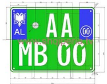
Figura III.4.2b, neni 246