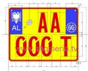
Figura III.4/2 b, rreth 248

TARGAT E MJETEVE RRUGORE NE SHERBIMIN TAXI