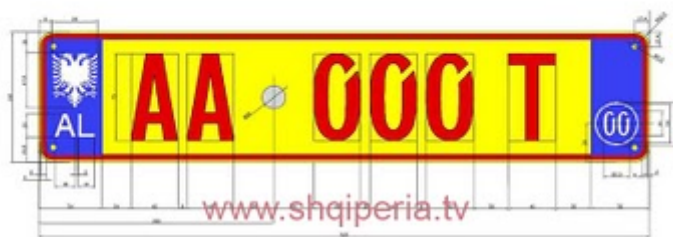
Figura III.4/1 b, rreth 248

TARGAT E MOTOMJETEVE RRUGORE BUKETORE DHE PRIVATE