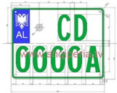
Figure III.4.2.4, neni 248

TARGAT E NECTIVE BRUGDEE TE TRUPIT DIPLOMATIK