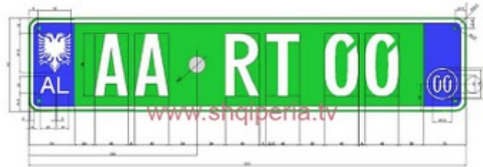
Figura III.4.23, nesli 248