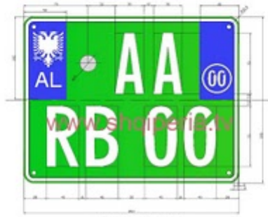
Figura III.4.23, nesli 248