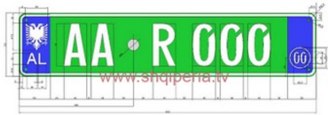
Figura III.471, neni 248