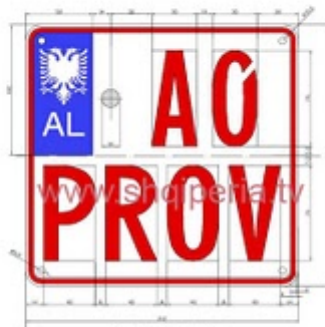
Figura III.3.C, rreth 248