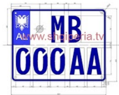
Figura III.4.2.4, rreth 248

TARGAT E MUEVEVE RRUGORE TE POLICISE ( MINISTRA E BRINDSHME)