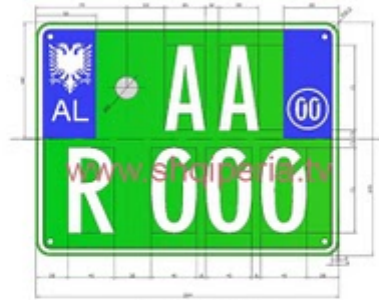
Figura III.472, neni 248