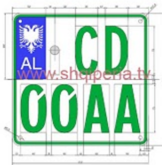
Figure III.3.4, neni 248

TARGAT E NECTIVE BRUGDEE TE TRUPIT DIPLOMATIK