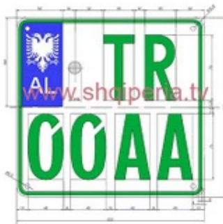
Figura III.31.c, neni 248

TARGAT E MOTOVE RRUGORE TE SHERBIMIT TE TRUPIT DIPLOMATIK