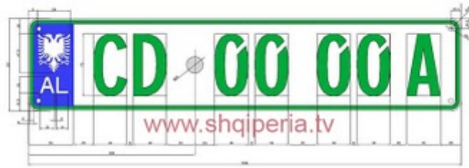
Figure III.4.1.4, neni 248

TARGAT E NECTIVE BRUGDEE TE TRUPIT DIPLOMATIK