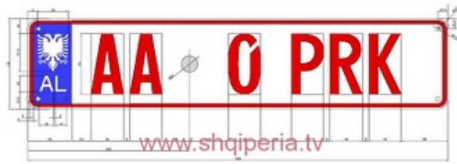
Figura III.41.e, neni 248