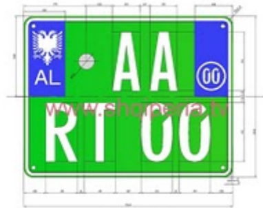
Figura III.4.23, nesli 248