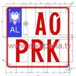
Figura III.51.e, neni 248

TARGAT E MOTOVAETIVE RRUGORE TE PËRDIHSHME