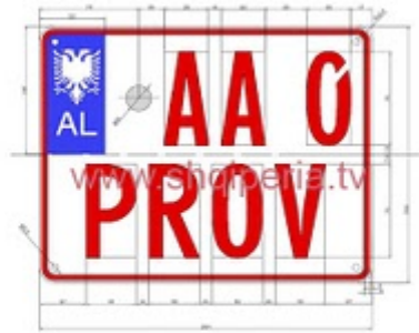
Figura III.4.2.E, rreth 248