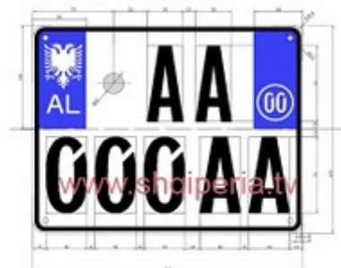
Figura III.4/2a, rreth 246

TARGAT E MJETEVE RRUGORE BAJHETORE DHE PRIVATE