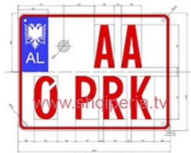
Figura III.42.e, neni 248