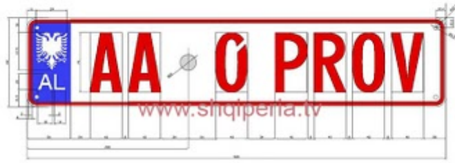
Figura III.4.1.E, rreth 248