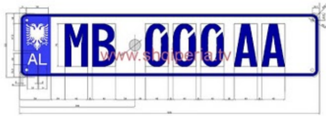
Figura III.4.1.6, rreth 248

TARGAT E MUEVEVE RRUGORE TE POLICISE ( MINISTRA E BRINDSHME)