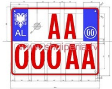
Figura III 4/2.g, nr.1 248