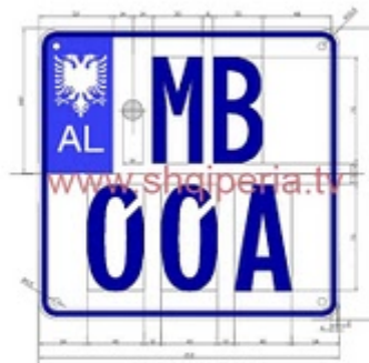
Figura III.5.3, rreth 248

TARGAT E MUEVEVE RRUGORE TE POLICISE ( MINISTRA E BRINDSHME)