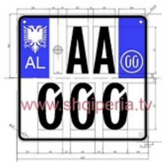
Figura III.3/a, rreth 248

TARGAT E MOTOMJETEVE RRUGORE BUKETORE DHE PRIVATE