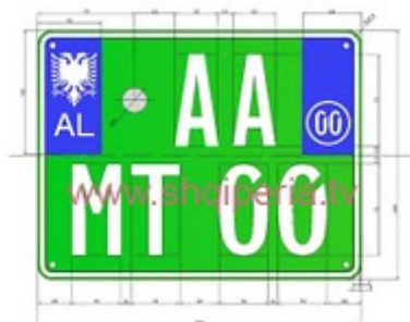
Figura III.4.2 i, neni 246