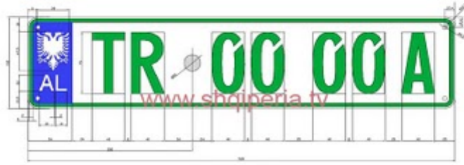
Figura III.41.c, neni 248

TARGAT E MOTOVE RRUGORE TE SHERBIMIT TE TRUPIT DIPLOMATIK