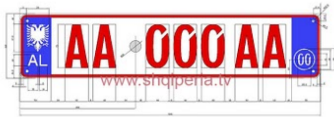
Figura III 4/1.g, nr.1 248