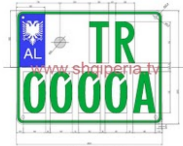
Figura III.42.c, neni 248

TARGAT E MOTOVE RRUGORE TE SHERBIMIT TE TRUPIT DIPLOMATIK