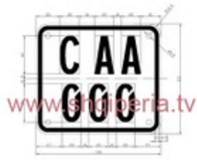
Figura III.3.1, neni 246