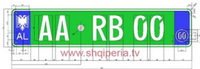
Figura III.473, neni 248