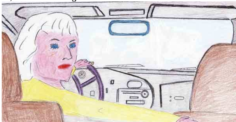
SGUARDO DI SICUREZZA ALL'INDIETRO (es. parcheggio, retromarcia)

Chi presenta queste difficoltà, nelle manovre di parcheggio, dovrebbe usare maggiormente gli specchi retrovisori in modo da evitare grandi torsioni della testa. In caso di grave artrosi della colonna vertebrale, consiglio di far controllare ad un medico, a scadenza regolare, l'idoneità alla guida.